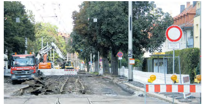
DRINGEND NOTWENDIG IST die Erneuerung der Gleise.

Strehlen. Am 21. August begannen die Gleis- und Fahrleitungsarbeiten im Bereich der Haltestelle „Hugo-Bürkner-Straße“. Ziel ist der barrierefreie Ausbau der Haltestelle in beiden Richtungen und eine sichere Wendemöglichkeit für Straßenbahnen. Die verschlissenen Gleisanlagen sollen bis Ende des Jahres erneuert werden. Auf insgesamt 900 Metern Länge werden zwischen der Haltestelle „Mockritzer Straße“ und der Dohnaer Straße sowie auf der Hugo-Bürkner-Straße und der Cäcilienstraße neue Gleise, zwei neue Weichen und eine eingleisige Abzweigung für die Wendemöglichkeit der Straßenbahn verlegt. An der Haltestelle in Richtung Wasaplatz werden elektronische Abfahrtsanzeigen, ein Fahrscheinautomat und Fahrradbügel installiert. Auf dem südlichen Gehweg werden zehn Bäume gepflanzt.