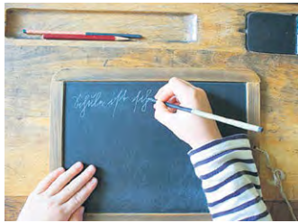
DAS SCHULMUSEUM WIDMET sich der Schulschriftgeschichte.

Jeder sollte sie beherrschen, mancher bemüht sich um deren Schönheit, um ihre Lesbarkeit sollte sich der Urheber jedoch immer bemühen – unsere persönliche Handschrift. Auch im Zeitalter des Tippens wird diese alte Kulturtechnik nicht verschwinden, sie ist eine Grundlage allen Kommunizierens. Das Schulmuseum hat sich nun in Ergänzung der ständigen Ausstellung dieser Seite des Schulalltags zugewandt – „Deutsche Schulschriften aus drei Jahrhunderten“ werden vorgestellt. Leider sind die meisten Belege Leihgaben, die zurückgegeben werden müssen, sie sind deshalb nur einige Monate zu sehen.