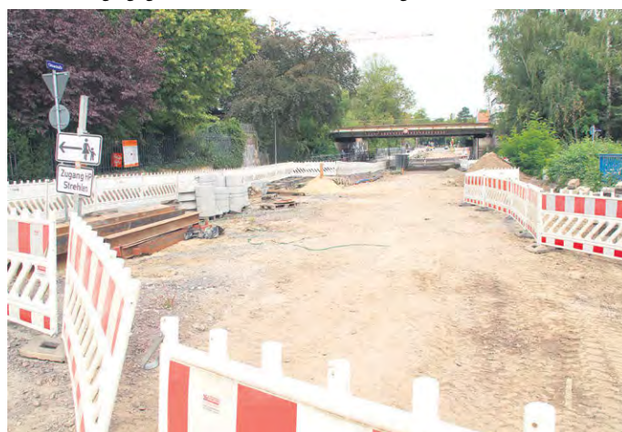
BLICK IN DIE ruhende Baustelle Oskarstraße.

Sollte im Frühjahr 2018 auf der Oskarstraße weitergebaut werden, wird die neue Strecke voraussichtlich im Herbst des gleichen Jahres fertig. Dazu gehört dann auch die teilweise Neugestaltung des Wasaplatzes. (Sd)