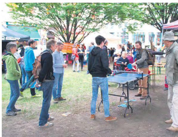
WÄHREND SICH DIE Erwachsenen beim Tischtennis beweisen konnten, waren die an einem Stand gebastelten Luftballonfiguren bei Kindern der absolute Renner.

nutzte auch eine noch namenlose Newcomer-Band, die zwar etwas länger als geplant zum Aufbau brauchte, aber die Wartenden mit fetziger Musik um so mehr erfreute. An einem der Stände stellte der Mensch Plauen e.V. zudem sein Projekt Südpark vor. In einem Hinterhofbereich an der Nöthnitzer Straße soll dabei ein gepflegter Bereich zum freien Gärtnern entstehen.