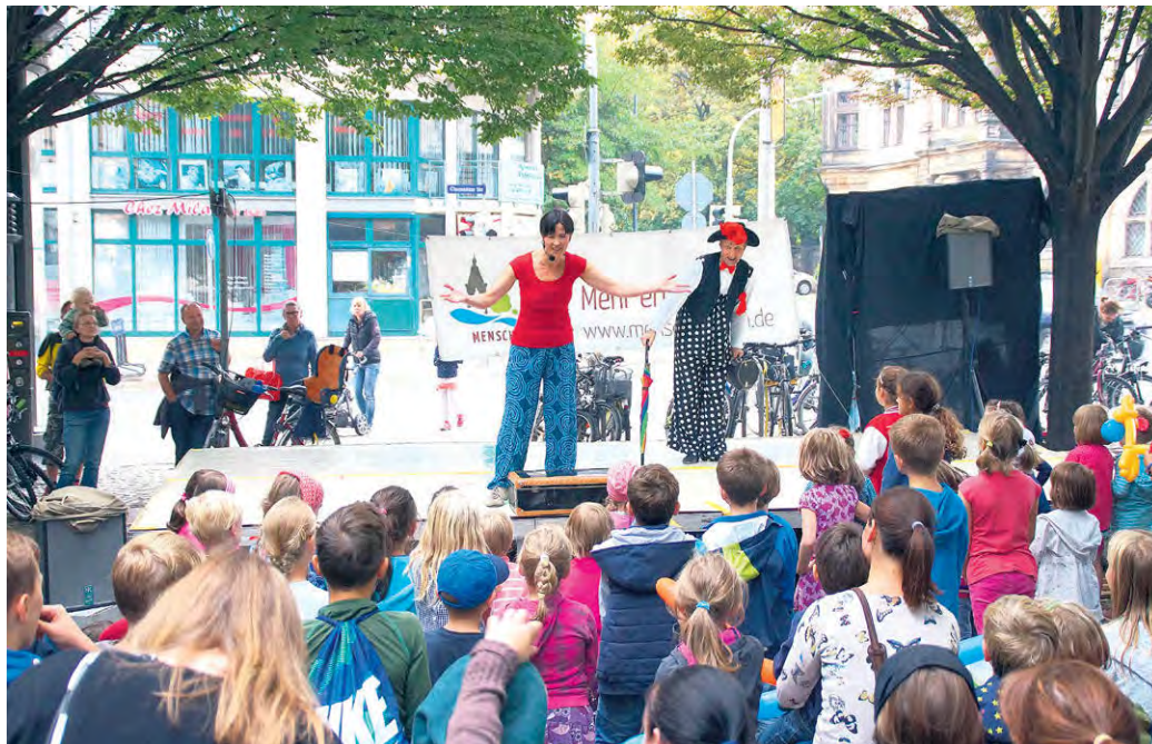
KINDERANDRANG AN DER Festbühne. Das Müllerbrunnenfest hatte am Nachmittag den Unterhaltungsschwerpunkt traditionell auf Kinder und Familien gelegt.

Südvorstadt. Eine Gruppe von zwölf Schülern der Breslauer Partnereinrichtung des Beruflichen Schulzentrums für Elektrotechnik hält sich derzeit in Dresden auf. Unter dem Thema „500 Jahre Reformation“ machen sich die Jugendlichen mit wichtigen Ereignissen der Reformationszeit und dem Wirken Martin Luthers vertraut. Sie beschäftigen sich mit der Kunst und Kultur des frühen 16. Jahrhunderts und besuchen Orte der Reformation in Dresden und Umgebung. (PZ)